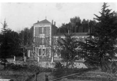
La villa Gaimard avant d'être transformée en école - AMA 36 Fi 29