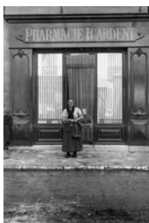
La pharmacie Icardent au