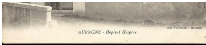
L'entrée de l'hôpital-hospice d'Aubagne du côté de la Route Nationale 8 - AMA 20 Fi 296