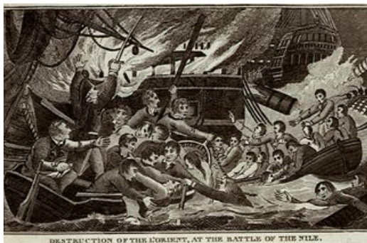
Evacuation et destruction de l'Orient à Aboukir, gravure

Honoré Ganteaume s'engage dans la Guerre d'Indépendance des Etats Unis dans les rangs de la marine française. Il doit se faire remarquer lors de cette guerre puisqu'il est nommé au grade de sous-lieutenant de vaisseau en 1786.