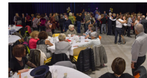
L'EAS organise tout au long de l'année un bal qui rassemble plus de 300 seniors sur une thématique chaque fois différente.