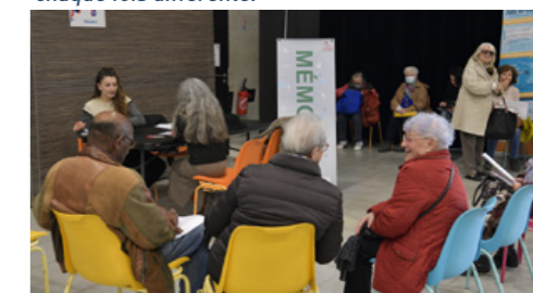
L'Espace Aubagne Seniors partenaire du check-up santé à l'Espace des libertés en mars dernier.