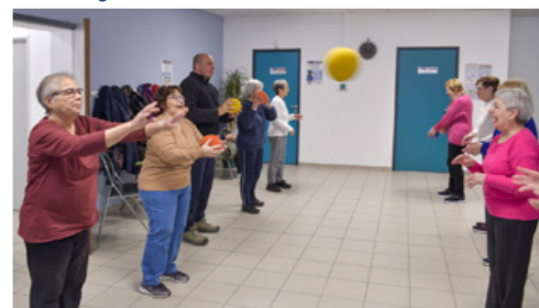
L'Espace Aubagne Seniors coordonne 13 ateliers de gym sur place et dans les maisons de quartier chaque semaine.