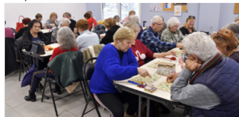
Tous les mardis 90 seniors se retrouvent pour un loto animé par des bénévoles seniors. Un partenariat entre l'ES13 et l'Espace Aubagne seniors.