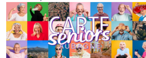
La Carte Seniors est gratuite et donne accès à toute une série de réductions, d'offres privilégiées et divers avantages.