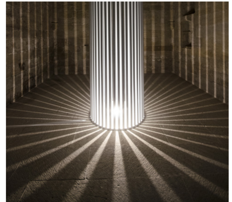
Une installation du collectif A.I.L.O.

Rendez-vous mercredi 11 octobre à 15h pour un départ depuis la Médiathèque Marcel Pagnol, chemin de Riquet, pour