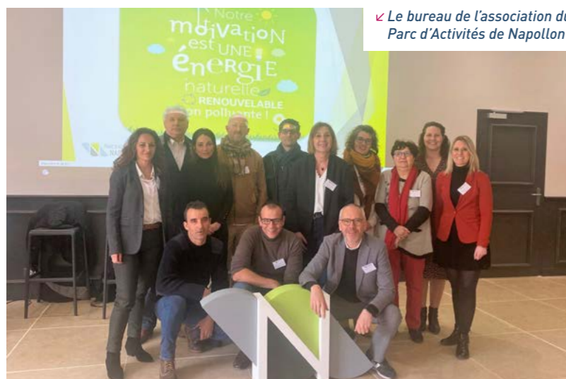
Le bureau de l'association du Parc d'Activités de Napollon