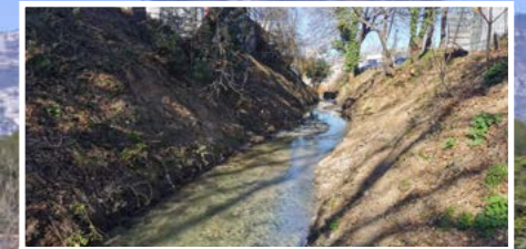
Renaturation, création de méandres et de zones humides au cœur du projet d'aménagement des berges de l'Huveaune