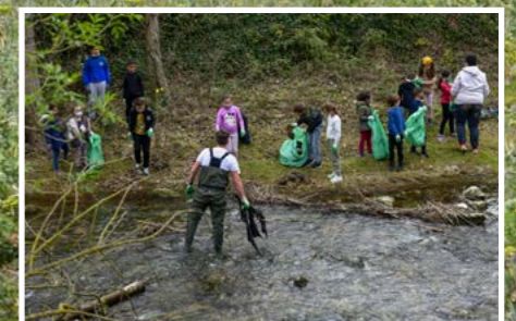
Les jeunes Aubagnais participent régulièrement aux actions de nettoyage des berges de l'Huveaune.