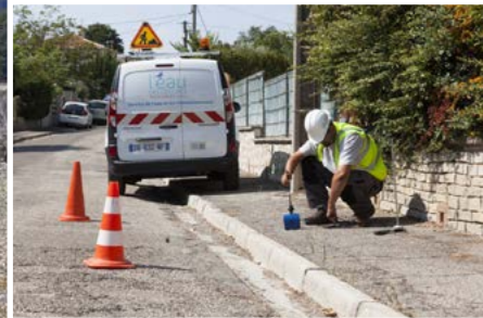
La préservation de la ressource passe par une surveillance rigoureuse du réseau souterrain