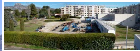
Au Pin-Vert, l'usine de potabilisation de la SPL L'Eau des Collines traite toute l'eau distribuée à Aubagne et La Penne-sur-Huveaune