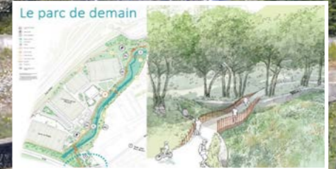
L'EPAGE HuCA met en œuvre la réhabilitation du lit de La Maire à Camp de Sarlier