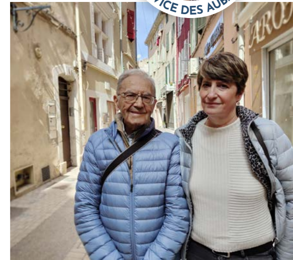
Les Amis du Vieil Aubagne Le Four à pain - 4 rue Torte - Aubagne Permanence les mardis, jeudis et samedis, de 10h à 12h.