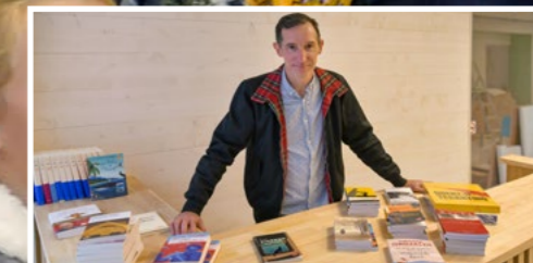
Les libraires d'Aubagne et du territoire, acteurs de l'événement