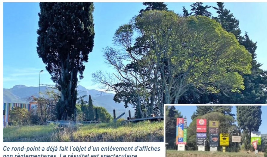
Ce rond-point a déjà fait l'objet d'un enlèvement d'affiches non réglementaires. Le résultat est spectaculaire.