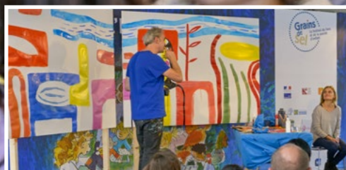
Participation à une fresque inspirée par l'auteur de l'affiche du festival