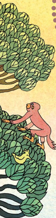
Illustration Jeanne Macaigne