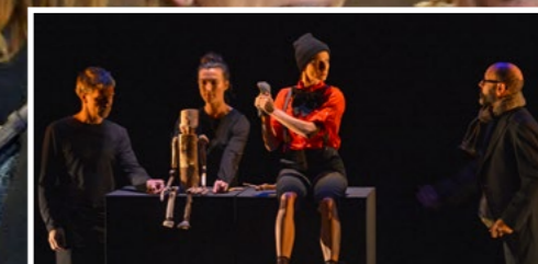
Le théâtre Comœdia dédie plusieurs scènes au festival