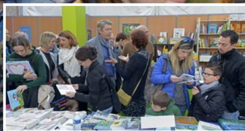
Rencontres entre auteurs et jeunes lecteurs