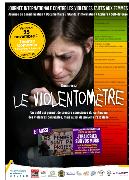
Le violentomètre : un outil simple et utile pour sensibiliser aux violences conjugales en "mesurant" si sa relation amoureuse est basée sur le consentement et comporte ou pas des violences.