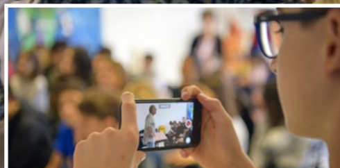
Ateliers et animations autour des droits et de la parole de l'enfant