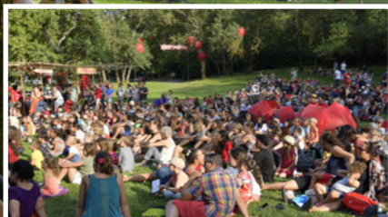
Festimôme, le festival attendu par les enfants et leurs familles