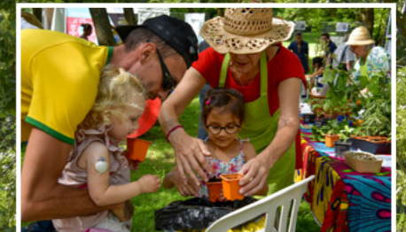
Fête de la Nature