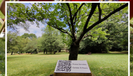
Un nouveau parcours botanique