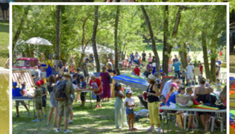
Fête des Familles