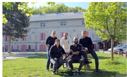
L'équipe du Centre de Vacances