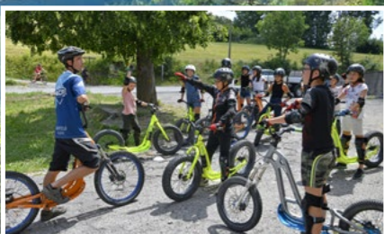
La nature en VTT