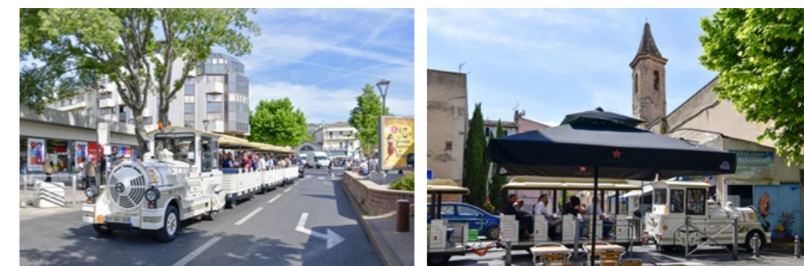
↑ Le 24 mai dernier, élus et agents des services de la Ville et de l'Office du Tourisme testaient en « grandeur nature », le futur parcours du Petit Train.