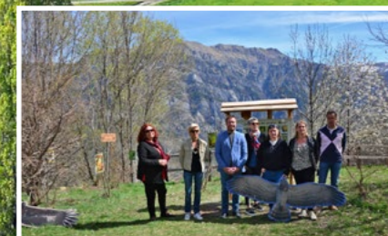
Inauguration de l'Observatoire aux Oiseaux