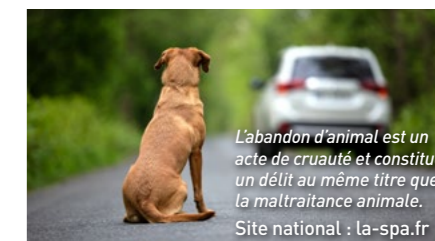
Labandon d'animal est un acte de cruauté et constitue un délit au même titre que la maltraitance animale. Site national : la-spa.fr

d'animaux y compris ceux qui peuvent momentanément se trouver dans une situation compliquée. Il y a toujours une solution alternative à l'abandon et des professionnels peuvent les aider. »