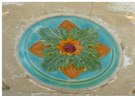
↑ L'un des cabochons de faïence ornant la façade