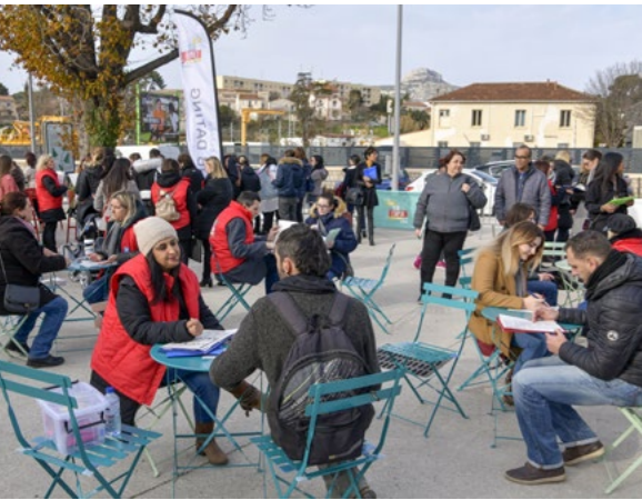
↑ « Place de l'Emploi, édition de janvier 2020 »

Le 28 juin, le village itinérant « La Place de l'Emploi et de la Formation » s'installe devant l'Espace des Libertés. Un moment privilégié pour se pencher sur sa carrière.