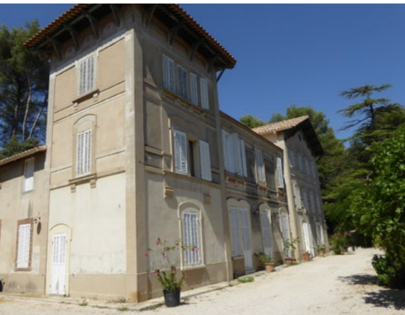
↑ La bastide Magnan, dans le quartier de Fenestrelles

Au cœur du projet d'agriculture périurbaine mené par la Ville d'Aubagne, la bastide Magnan a été aménagée en 1896 par Léon Magnan, riche industriel marseillais.