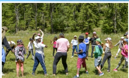
Bivouac en forêt