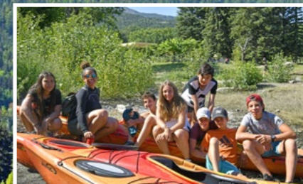
Activités en eau vive ou sur le lac