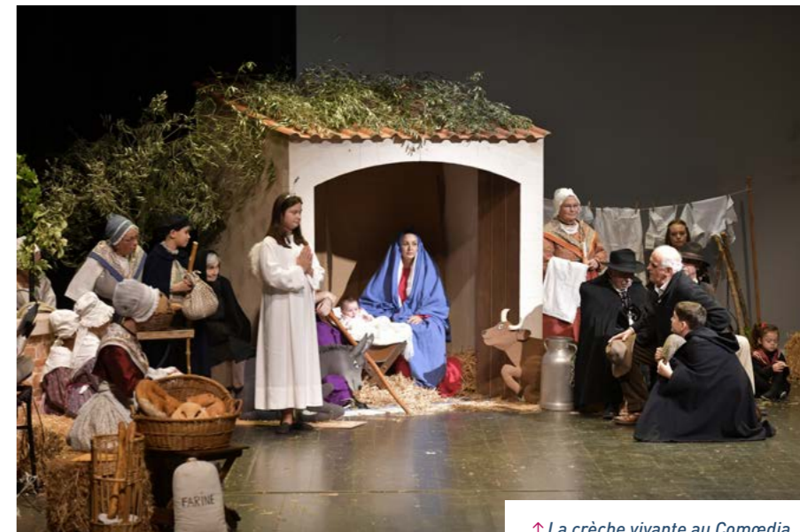
↑ La crèche vivante au Comœdia.