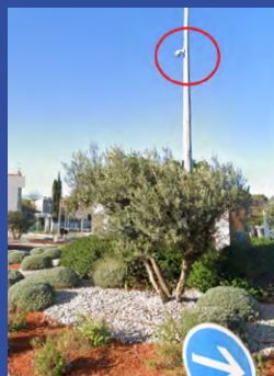
Caméra rond-point du Pin Vert

Nombre total de caméras sur le secteur Pin Vert : 6 (au 1 er janvier 2023)