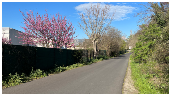
Chemin du Vallon