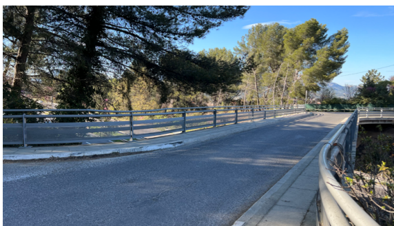
Passerelle de la Fourmi