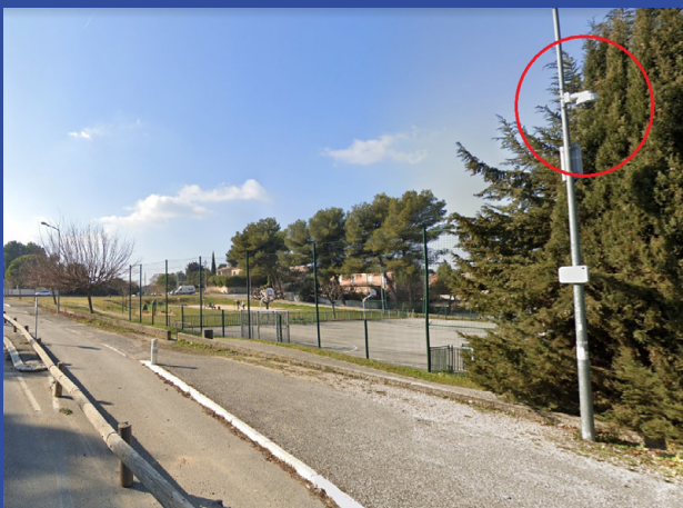
Plateau des Espillières

À Aubagne Sud, ce sont 3 caméras qui quadrillent le quartier, ses axes principaux de circulation, ses places publiques et ses rues.