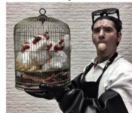
▼ La compagnie Intrepidus présente Stek