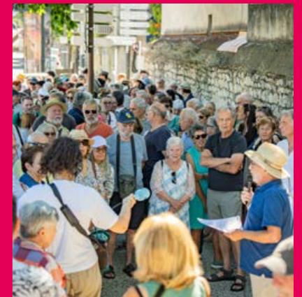
Rassemblement pour la gratuité devant la Gare d'Aubagne, le 13 juin 2026

Restons toutefois vigilants : ce budget n'est qu'un sursis. La question de la pérennisation de la gratuité reviendra inévitablement dans les débats métropolitains.