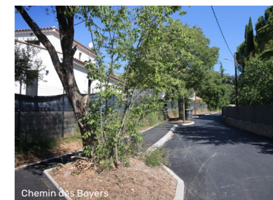
Chemin des Boyers

Les services de la Ville ont également aménagé le nouveau city stade 3 raquettes en bordure de l'Huveaune, avec ses trois terrains dédiés au tennis, au badminton et au tennis de table, rapidement adoptés par les pratiquants de sports de raquette !