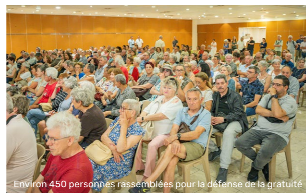
Environ 450 personnes rassemblées pour la défense de la gratuité