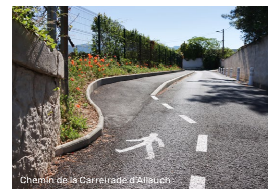
Chemin de la Carreirade d'Allauch

D'autre part, les habitants ont pu constater la réhabilitation complète de plusieurs rues de la ville : l'allée de Lamagnon, le chemin de la Carreirade d'Allauch (entre la D96 et Longue-lance), mais aussi le chemin des Boyers, qui a littéralement changé de visage avec la création d'un trottoir permettant une circulation piétonne sécurisée. Ces réhabilitations ont été réalisées par l'entreprise Eiffage Route. Le nouveau rond-point des Solans améliore, quant à lui, la fluidité de la circulation dans un quartier qui va rapidement évoluer avec la prochaine mise en service du Val'Tram.