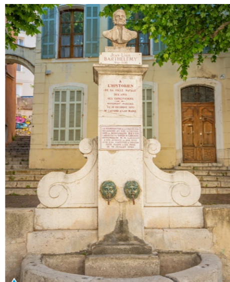
Fontaine Barthélemy Fontaine de la Halle

Cette initiative s'inscrit dans une démarche globale de transformation du centre ancien, conciliant valorisation du patrimoine, qualité de vie et redynamisation du cœur de ville.