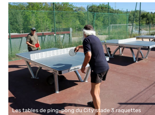
Les tables de ping-pong du City stade 3 raquettes

novés au premier semestre, auxquels s'ajoute un feu réparé à la suite d'un accident. Le feu régulant le carrefour Mermoz/Ganteaume sera réhabilité à la fin du mois de juin.