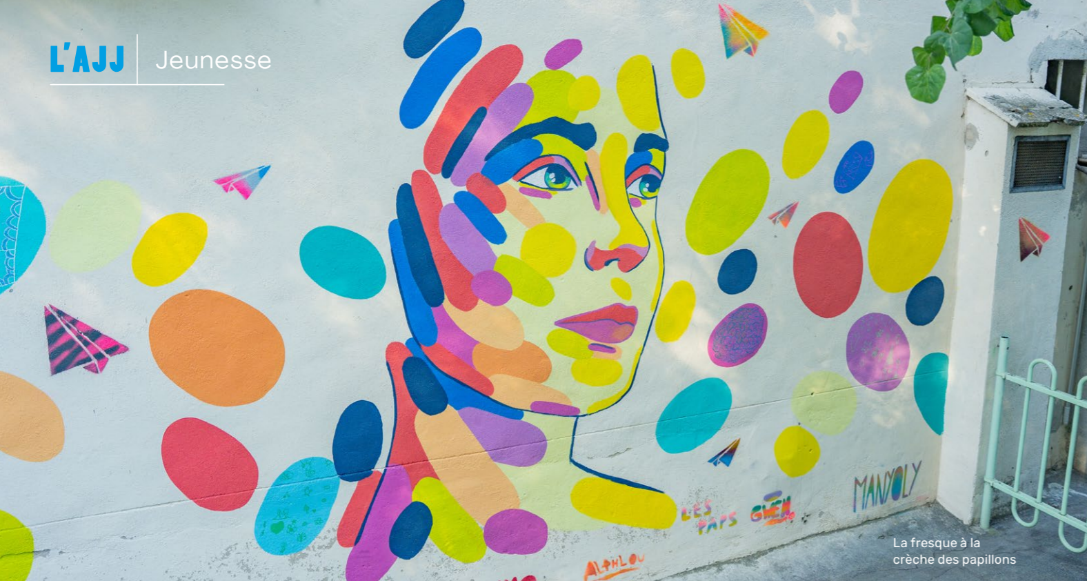
La fresque à la crèche des papillons