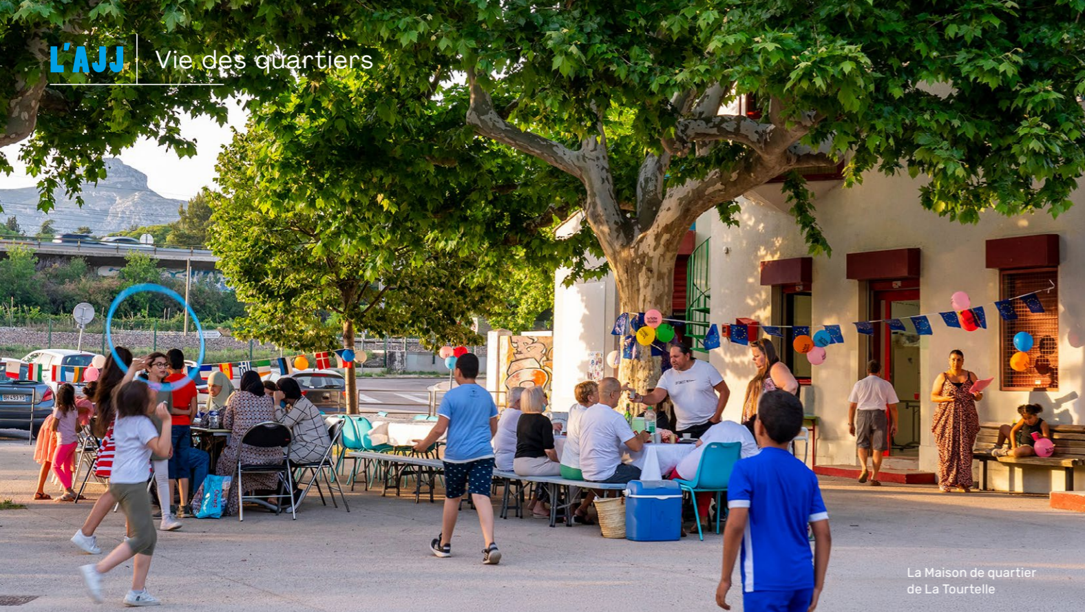
La Maison de quartier de La Tourtelle