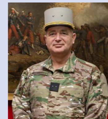
Général de brigade Cyril YOUCHTCHENKO Commandant de la Légion étrangère

institution militaire, source de fierté pour les Aubagnais qui accueillent la Légion avec respect et admiration en partageant les valeurs d'honneur et de fraternité qu'elle incarne. Cette relation aussi forte que symbolique, entretenue avec ferveur et sincérité, s'est traduite par l'élévation de la ville d'Aubagne au grade de 1 re classe d'honneur de la Légion étrangère en 2022 . Cette distinction témoigne des liens indéfectibles qui unissent aujourd'hui la Légion à la ville d'Aubagne.