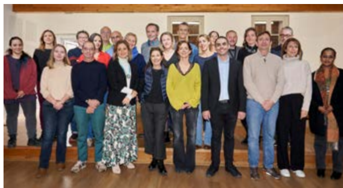
L'équipe du Conservatoire