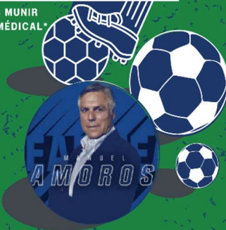
AMBASSEUR DU SPORT MANUEL AMOROS

Espace Multisports MOUSSOU - BOUC-BEL-AIR