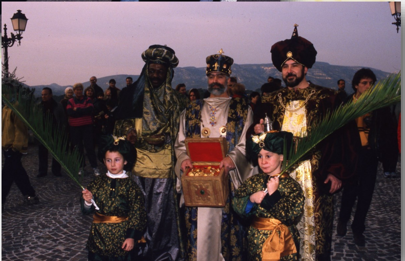
Première Marche des Rois à Aubagne, 08/01/2000