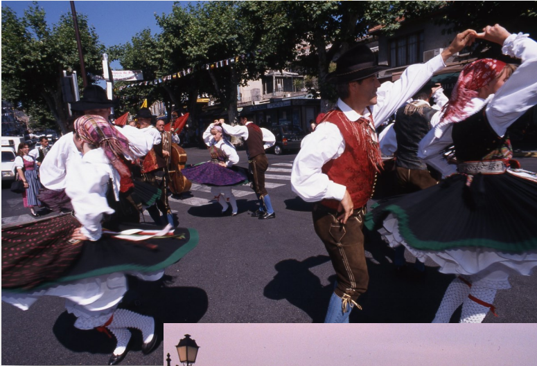
Le groupe autrichien « Edelweiss » sur la place Pasteur lors du festival Aquarelle en 1998