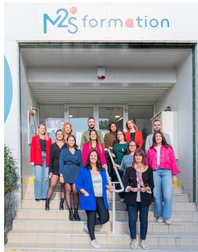
L'équipe de formateurs