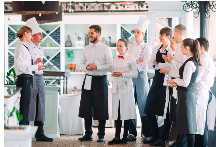
Une formation pour tous les métiers

Située à Aubagne, au Château des Creissauds, l'École Hôtelière de Provence est un lieu idéal de formation. L'École dispose de 9 salles de formation et d'un restaurant pédagogique qui permet aux étudiants de mettre en application la théorie sur des travaux pratiques en Gastronomie, Bistronomie, Bar à cocktail et tout autre style de restauration. Un parking de 150 places est accessible pendant les heures d'ouverture de l'établissement.