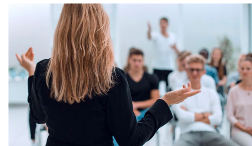
Une formation pour les futurs formateurs

GRETA-CFA Collège Lakanal Avenue Robespierre 13400 Aubagne