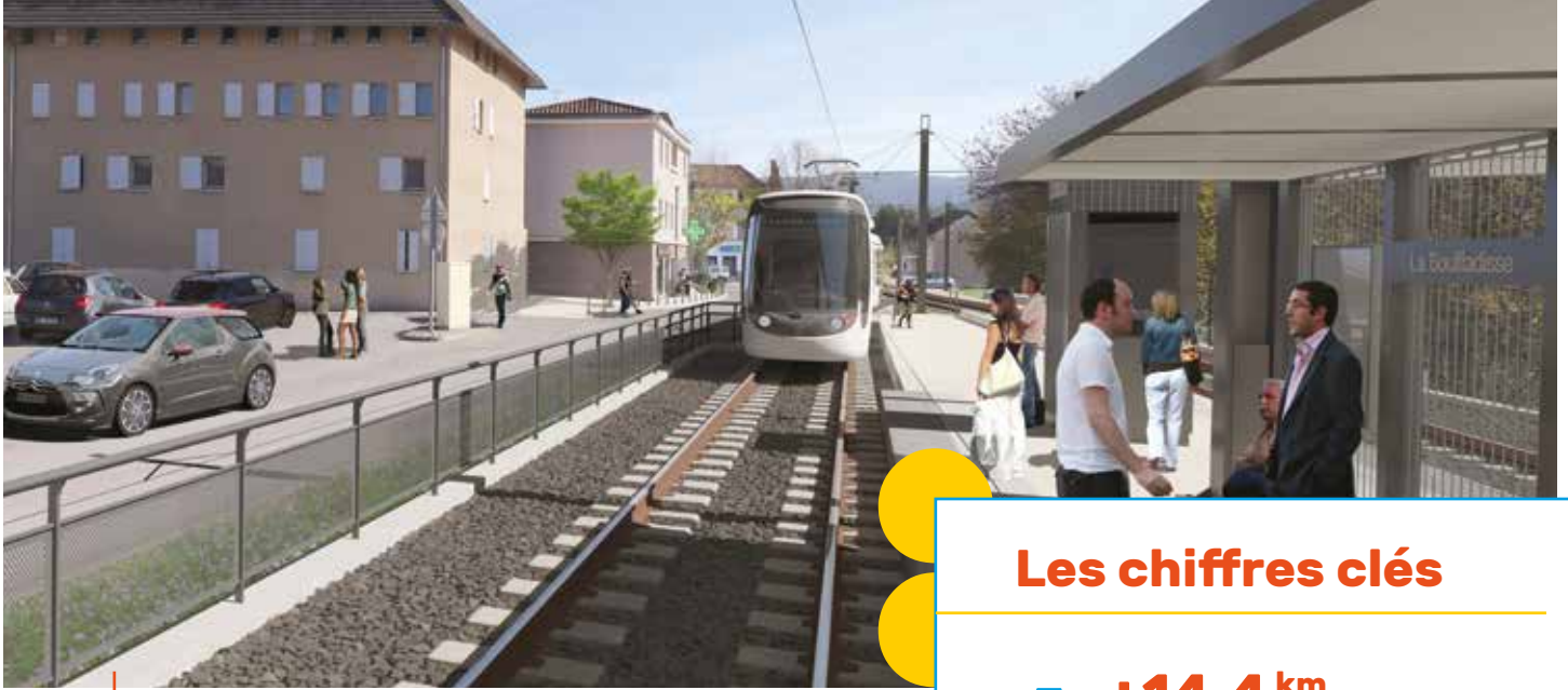
Terminus au centre de La Bouilladisse